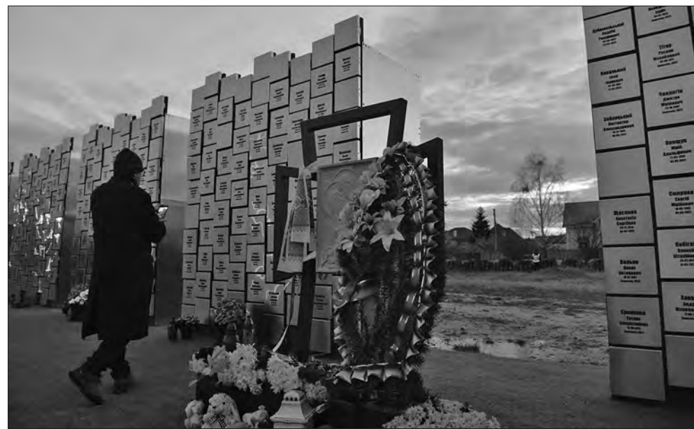
Біля Меморіалу жертвам російського вторгнення в Бучі (Київська область).