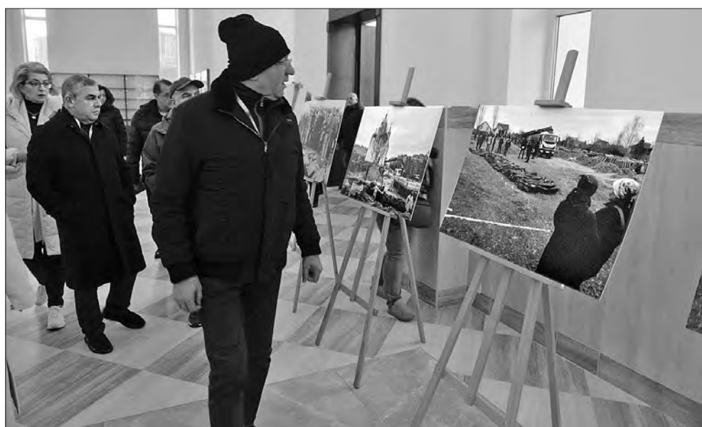
Під час відвідування церкви Святого Апостола Андрія Первозваного та Всіх Святих (місто Буча).

Представник румунської делегації зі свого боку зауважив, що в Бучі та Ірпені делегати побачили і зрозуміли, що таке «руській мір». «Важко усвідомити, що такі звірства могли вчинити люди, але ми на власні очі переконалися в цьому», — сказав він, наголосивши, що Україна