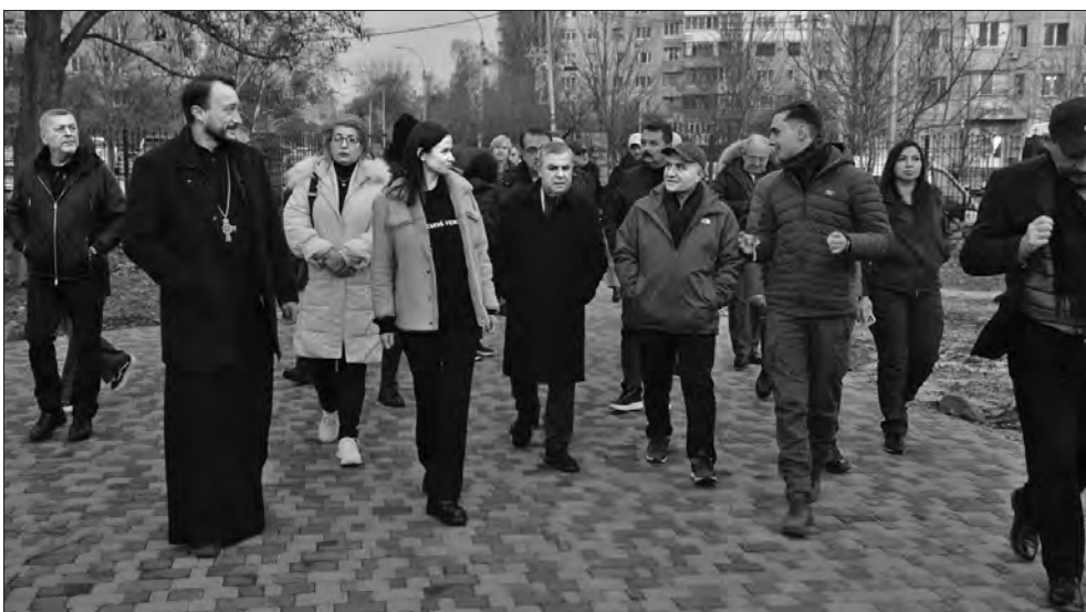
Представники делегації Парламентської асамблеї Організації Чорноморського економічного співробітництва в місті Бучі.

«Я вдячна всім іноземцям, які до нас приїхали. Сьогодні вони на власні очі побачили те, що зробила росія, коли окупувала нашу територію в Київській