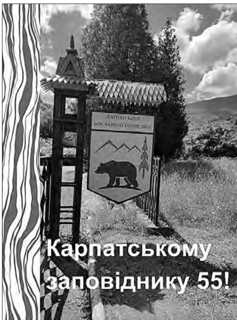
Карпатському заповіднику 55!

Карпатський біосферний заповідник створено на базі Карпатського державного заповідника згідно з Указом Президента України № 563 «Про біосферні заповідники в Україні» в 1993 р.