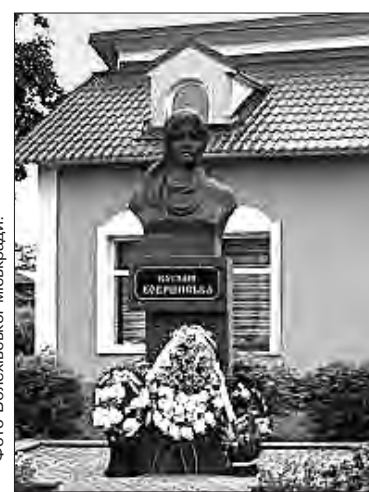
Пам'ятник Кобринській у Болехові.

Власне, культурно-туристичним маршрутом міська рада прагне сприяти популяризації історико-культурної спадщини Болехівської територіальної громади, підвищенню її іміджу й привабливості. В межах проєкту встановлять інформаційні стенди на кожній локації. Буде створено веб-сторінку для доступності онлайн, мапу, буклети та сувенірну продукцію, які даватимуть поглиблені знання про життя Наталії Кобринської та загалом мистецької спільноти на території краю.