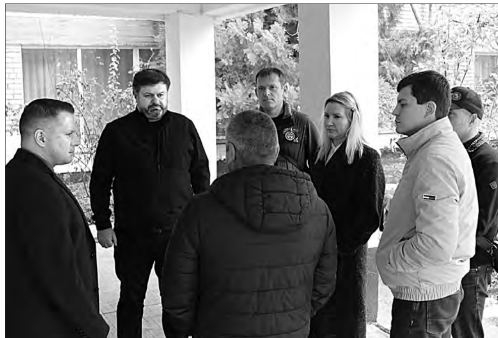
У храмі делегати на власні очі побачили фотосвідчення російських звірств