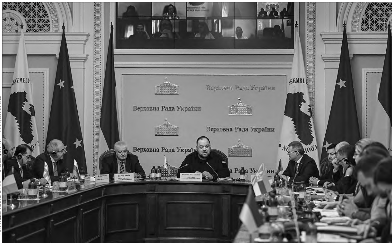
Більше фото тут — www.golos.com.ua

Пленарне засідання 62-ї Генасамблеї оголосив відкритим Президент ПАЧЕС Голова Верховної Ради України Руслан Стефанчук. Очільник українського парламенту привітав усіх делегатів асамблеї, які приїхали до Києва попри розгорнуту російською федерацією агресію для того, щоб особисто взяти участь у запланованих заходах. «Ваша присутність — це ваш прояв справжньої дружби і сигнал підтримки», — сказав він.